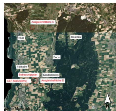
Übersichtslagepläne o. M.